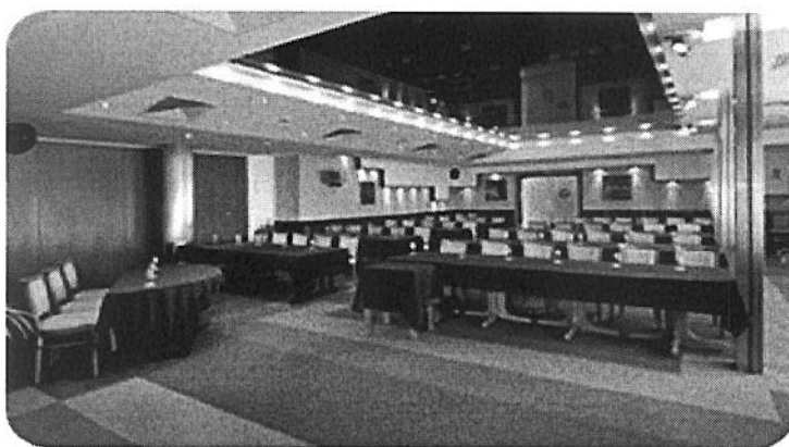
Дължина/ ширина – 15 м /10 м. Площ – 150 кв.м