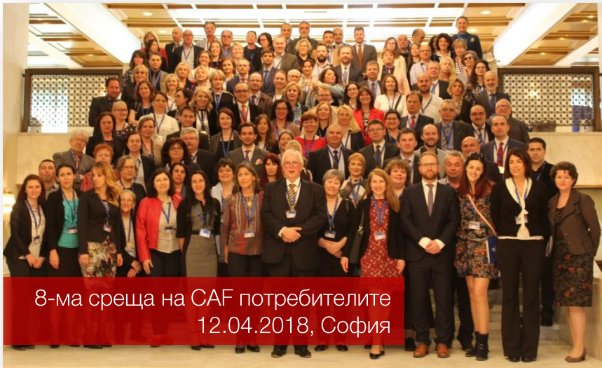
8-ма среща на CAF потребителите 12.04.2018, София