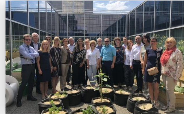
Работна група CAF 2020, Брюксел, юли 2018