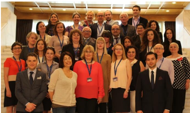
Работна група CAF 2020, София, април 2018

За проучване на нуждите от развитие на модела бяха проведени две изследвания. Едното се направи преди 8-та среща на CAF потребителите, на 12 април 2018 г., а другото – след нея. Освен нуждите на потребителите, в Модела ще бъдат отразени и основните насоки на ЕК относно необходимостта от непрекъснато развитие на публичния сектор в ЕС и привеждането му в унисон с новите политики. Основен акцент ще се постави върху качеството на резултатите, качеството на реформите и върху служителите в публичния сектор, които ще бъдат в основата на успеха. Бъдещото финансиране с ресурси на общността все по-тясно ще бъде обвързано с качеството на реформите в публичния сектор, което прави използването на инструменти за цялостно управление на качеството още по-наложително.