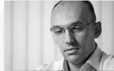
Крум Гърков, Директор на Европейска агенция за управление на големи информационни системи в областта на вътрешния ред и сигурност

Работата на EU-LISA е свързана с информационното осигуряване при управлението на границите и осигуряване изпълнението на миграционните политики на ЕС. През септември 2017 г. агенцията внедри CAF след проучване на възможностите на различни инструменти за цялостно управление на качеството. Според направеното проучване CAF осигурява нужния баланс между вътрешните ресурси, които е необходимо да се вложат и резултатите, които получава организацията от прилагането на инструмента.