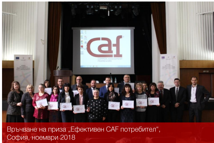
Връчване на приза „Ефективен САФ потребител“, София, ноември 2018