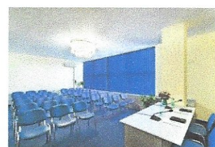
Зала „Конферанс“ 2/3/4