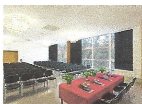
Зала „Конферанс“ 1/5