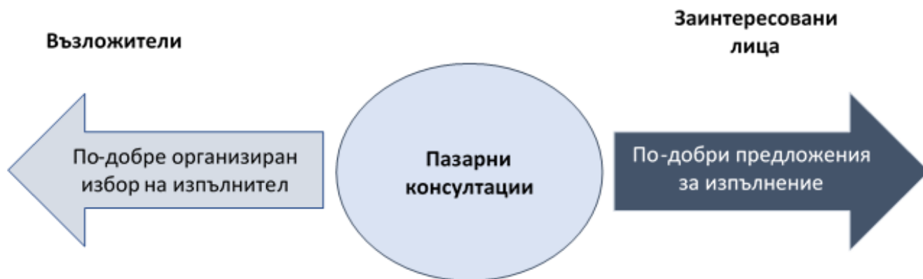
Фигура 1. Функции на пазарните консултации

Приложното поле на пазарните консултации може да се отнесе към всяка обществена поръчка, независимо от нейните вид, специфични особености и характеристики. Законодателят не поставя ограничения в този смисъл и освен постигането на по-благоприятни условия при провеждането на избора, възложителите могат да използват пазарната консултация свободно, вкл. и с цел отпращане на заявление за откритост и прозрачност. Анализът на обновеното съдържание на процедурите за възлагане на обществени поръчки, показва, че пазарните консултации могат да бъдат особено успешно използвани в случаите, в които се касае за дейности, отличаващи се с особена степен на сложност. Такива биха могли да бъдат обществени поръчки, свързани с някое или няколко от следните обстоятелства: